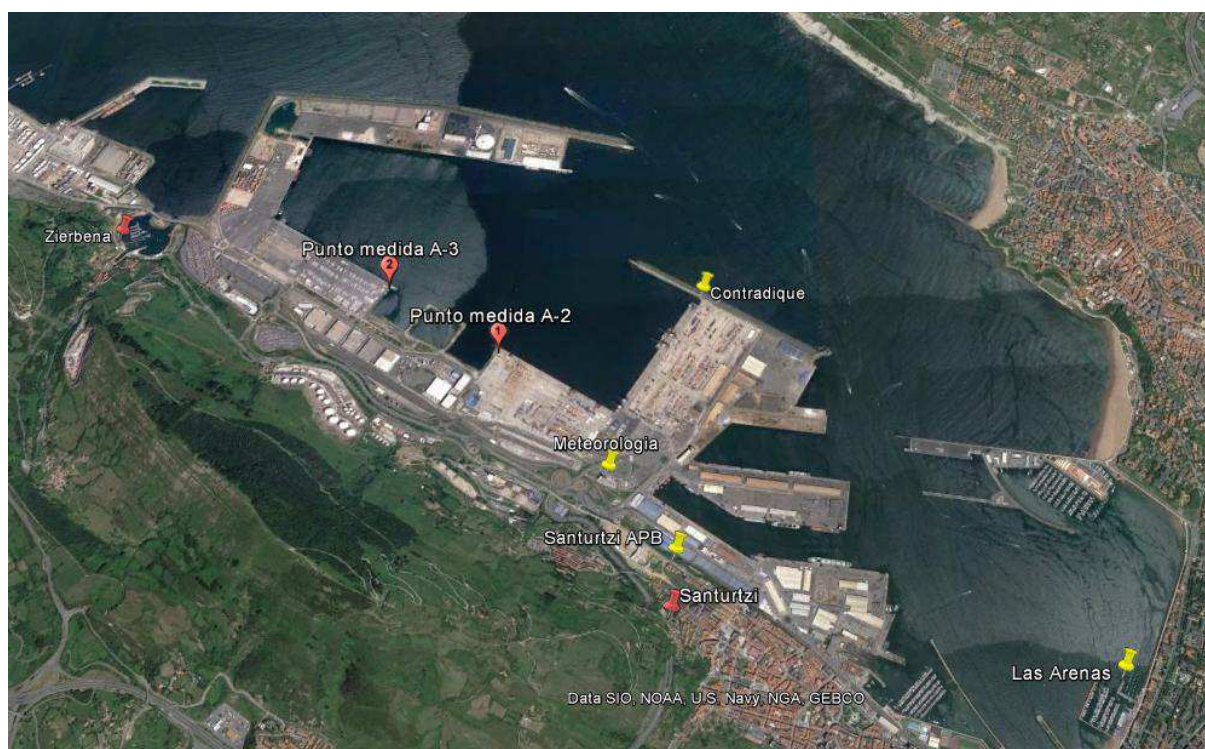
Figura 2. Localización de las estaciones analizadas.

Además se han analizado los datos presentados en las estaciones de los entornos urbanizados mas cercanos, pertenecientes a la red de calidad del aire del Gobierno Vasco. (Figura 2)