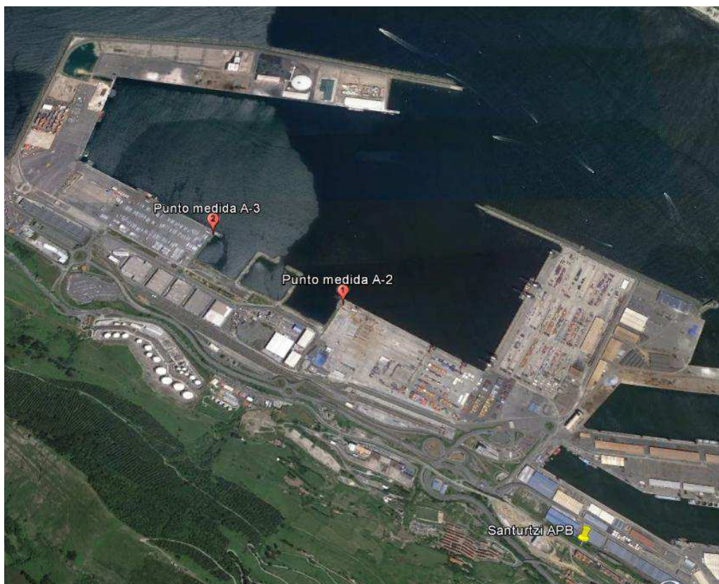
Figura 1. Localización de las tres estaciones de muestreo de calidad de aire y nivel de ruido.

Se presentan a continuación las ubicaciones de los distintos puntos de control para la realización de las campañas de medida.